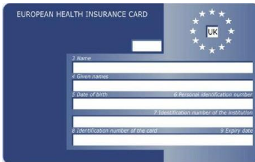
Vorderseite Vereinigtes Königreich – Wales