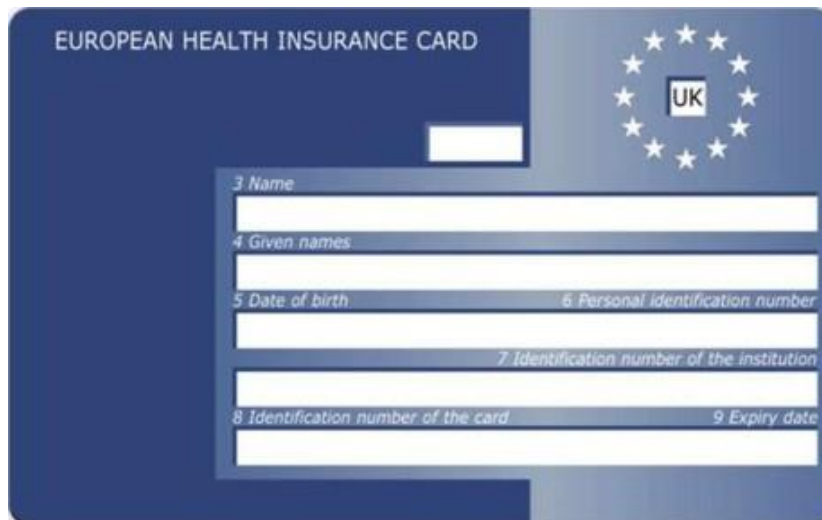
Vorderseite Königreich - England - Schottland