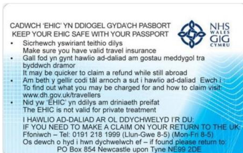
Rückseite Vereinigtes Königreich – Wales